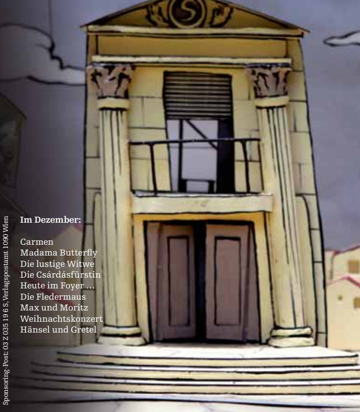
Bühnenbildmodell für „Die spinnen, die Römer!“ von Friedrich Despalmes