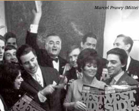
Marcel Prawy (Mitte)