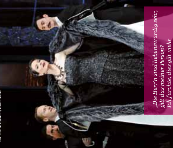
„Die Herr'n sind Liebenswürdig sehr, gilt, das meiner Person? Ich fürchte, dies gilt mehr meiner vielfachen Million!“ Hanna Glawari in „Die lustige Witwe“, 1. Akt

Programmvorschau Jänner 2012 mit der Premiere Candide (konzertant) am 22. Jänner 2012