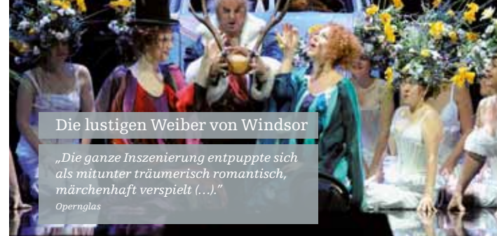
Die lustigen Weiber von Windsor

„Die ganze Inszenierung entpuppte sich als mitunter traumatisch romantisch, märchenhaft verspielt ...“ Opernlab