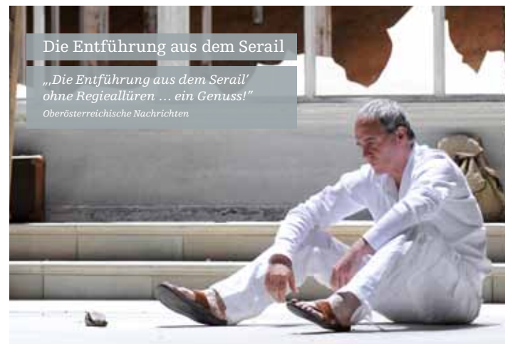
Die Entführung aus dem Serail

„Diese Produktion ist ein Garant für einen unbeschwertten Abend, der mit Gags unüberhörbar Kinderherzen begeistert und ein Lächeln auf so manches Erwachsenen-gesicht zaubert.“ Wiener Zeitung