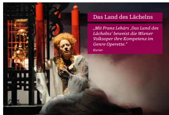
Das Land des Lächelns

Schüler, Studenten (bis 27 Jahre), Lehrlinge, Präsenz- und Zivil-dienste, Arbeitslose: Restkarten erhalten Sie zum ermäßigten Preis von 12,- (Preise A, B), 10,- (Preise C), 6,- (Preise V) ab 20 Minuten vor Vorstellungsbeginn an der Abendkasse.