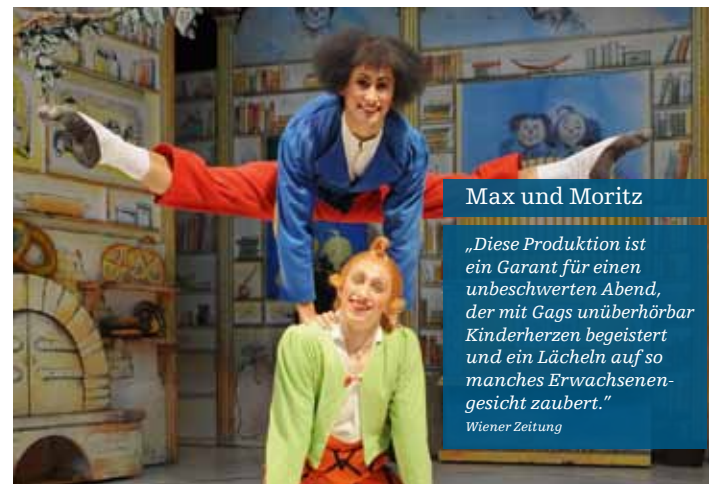
Max und Moritz

„Mit Franz Lehárs ‚Das Land des Lächelns‘ beweist die Wiener Volksoper ihre Kompetenz im Genre Operette.“ Kurier